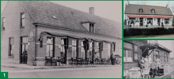
1 Restaurant Stad Parijs in 1940 (links), in 2013 (boven) en noodlokaal in 1944 (onder).