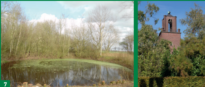
Poel bij industrieterrein Haansberg.

Staan in de buurt van Stad Parijs hebt u waarschijnlijk niet het gevoel dat uw vertrekpunt in Hulden ligt. Toch is het zo. Wat in een ver Germaans verleden 'Holten', 'Hoelten' of 'Hoilen' genoemd werd, is vanaf de 18e eeuw definitief Hulden. 'Hult' zou best wel 'holt', 'holz', 'hout' kunnen betekenen, of beter nog: 'bos' of 'bosjes'. Hulden ligt nog steeds tussen bos (de zuidkant) en broek (de noordkant).